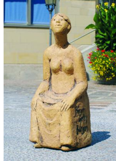
Spendedose „Bürger helfen Bürgern“.

In den ersten Jahren wird die Bürgerstiftung einen Schwerpunkt auf die Jugend- und Seniorenarbeit legen.